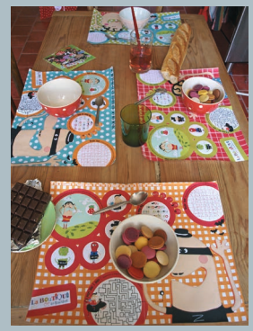
Format 30 x 40 cm.

Retrouvez la boutique de la Tartine sur internet : www.latartine.org Cliquez sur la fleur «le blog» et en colonne de gauche sur «la Boutique».