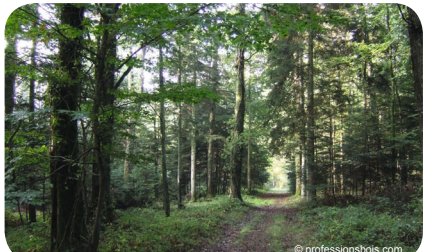
Forêt de Ray, Perche.

Pour travailler dans la forêt, il faut aimer vivre en plein air. Qu'il pleuve, qu'il vente ou qu'il neige, on est toute l'année dehors : en pleine nature, plus rarement en ville ou au bord des routes. En rapport constant avec la nature, ces métiers nécessitent une très bonne forme physique. Parfois les conditions sont difficiles : froid, humidité, sols glissants... Des aptitudes physiques sont aussi indispensables pour manier les outils. Enfin, le sens de l'orientation et l'esprit d'équipe sont primordiaux.